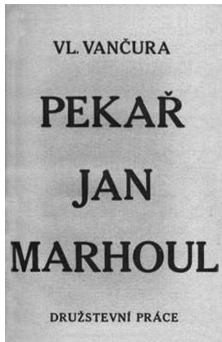
Vančura; Vladislav; Pekař Jan Marhoul. – 1924. 1. vyd. Živé knihy, obálka Karel Teige. Družstevní práce